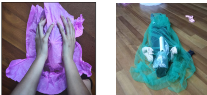
FIGURA 1 – PRIMEIRA PROPOSTA DO CORPOCOISA