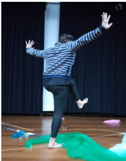
FIGURA 2 – SEGUNDA PROPOSTA DO CORPOCOISA

espaço, delimitando um espaço físico cênico. Em seguida, cada pessoa colocou uma das matérias ali disponíveis em um local do espaço, formando uma composição espacial com todas as matérias, inseridas uma a uma, até formar um novo “cenário” investigativo. Depois, cada criador teve um tempo para dançar por entre essas matérias, permitindo que seu corpo fosse mais uma matéria compondo aquele espaço. O foco dessa proposição era se deixar mover pelos convites das matérias ali expostas, percebendo como cada textura, cor, forma promovia estados corporais. Cada composição da matéria no espaço, assim como os movimentos dos corpos por entre essas matérias, teve relação com uma percepção familiar e poética – familiar no sentido do que é funcional dos objetos e poética quando se abrem outras possibilidades de relação sensorial e simbólica das coisas. Essas relações, familiar e poética, provocaram modos de o corpo se mover, modificam seus gestos, organizam e reorganizam suas estruturas posturais (Figura 2).