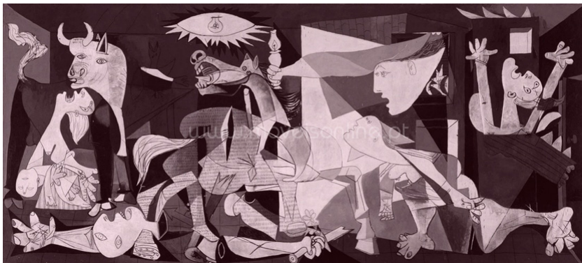
FIGURA 1: GUERNICA, MURAL DE 349CM X 776CM, COMPOSTO POR PABLO PICASSO (1937).

científicas estão vinculadas a métodos especializados, cada ciência obtém explicações diferentes para um mesmo fenômeno – não há ciência que gere uma visão unificada do real. Em terceiro lugar, a ciência consegue descrever apenas partes e pedaços do mundo, o que fatalmente gera paradoxos a cada vez que o cientista adentra novos territórios. Neste sentido, a episteme não é suficiente para o conhecimento do mundo.