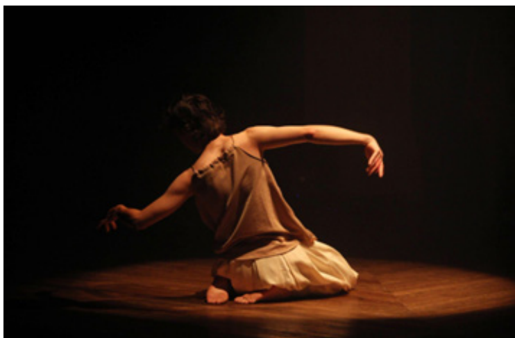
FIGURA 3 – SOLO 1: ARKBZ, DE LUAN LINKOSKI